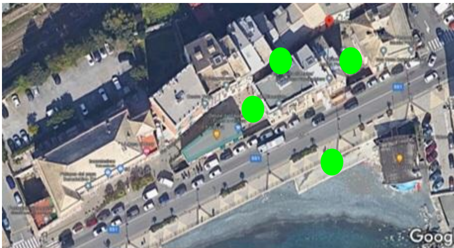
Via Carloforte, Piazza Giacomo della Chiesa, Piazza Tabarca, Piazza San Pietro