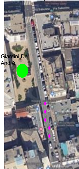
Giardini De Andrè