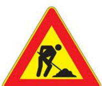
Figura II 383 Art. 31 LAVORI