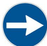
Figura II 80/c Art. 122 DIREZIONE OBBLIGATORIA A DESTRA