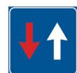
Figura II 45 Art. 114 DIRITTO DI PRECEDENZA NEI SENSI UNICI ALTERNATI