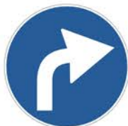
Figura II 80/d Art. 122 PREAVVISO DI DIREZIONE OBBLIGATORIA A DESTRA