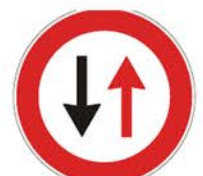
Figura II 41 Art. 110 DARE PRECEDENZA NEI SENSI UNICI ALTERNATI