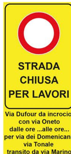
Figura II 403 Art. 42 STRADA CHIUSA PER LAVORI Via Dufour da incrocio con via Oneto dalle ore ...alle ore... per via dei Domenicani- via Tonale transito da via Marino