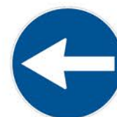
Figura II 80/b Art. 122 DIREZIONE OBBLIGATORIA A SINISTRA